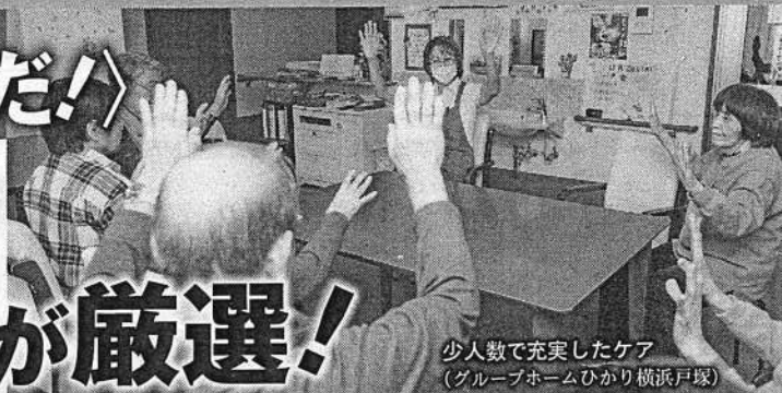
少人数で充実したケア (グループホームひかり横浜戸塚)