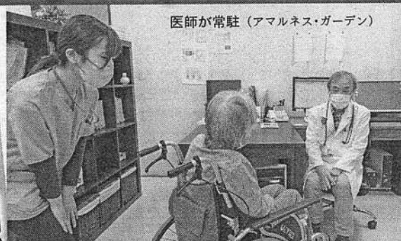
医師が常駐 (アマルネス・ガーデン)