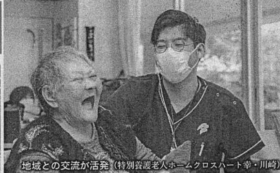
地域との交流が活発 (特別養護老人ホームクロスハート幸・川崎)