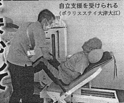
自立支援を受けられる (ポラリスステイ大津大江)