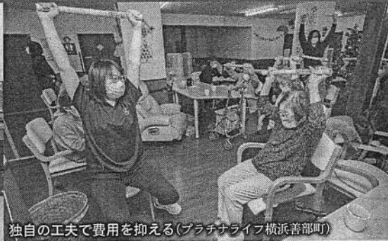
独自の工夫で費用を抑える (プラチナライフ横浜善部町)