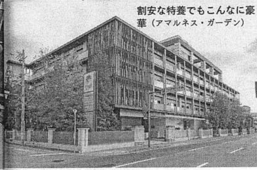
割安な特養でもこんなに豪華 (アマルネス・ガーデン)